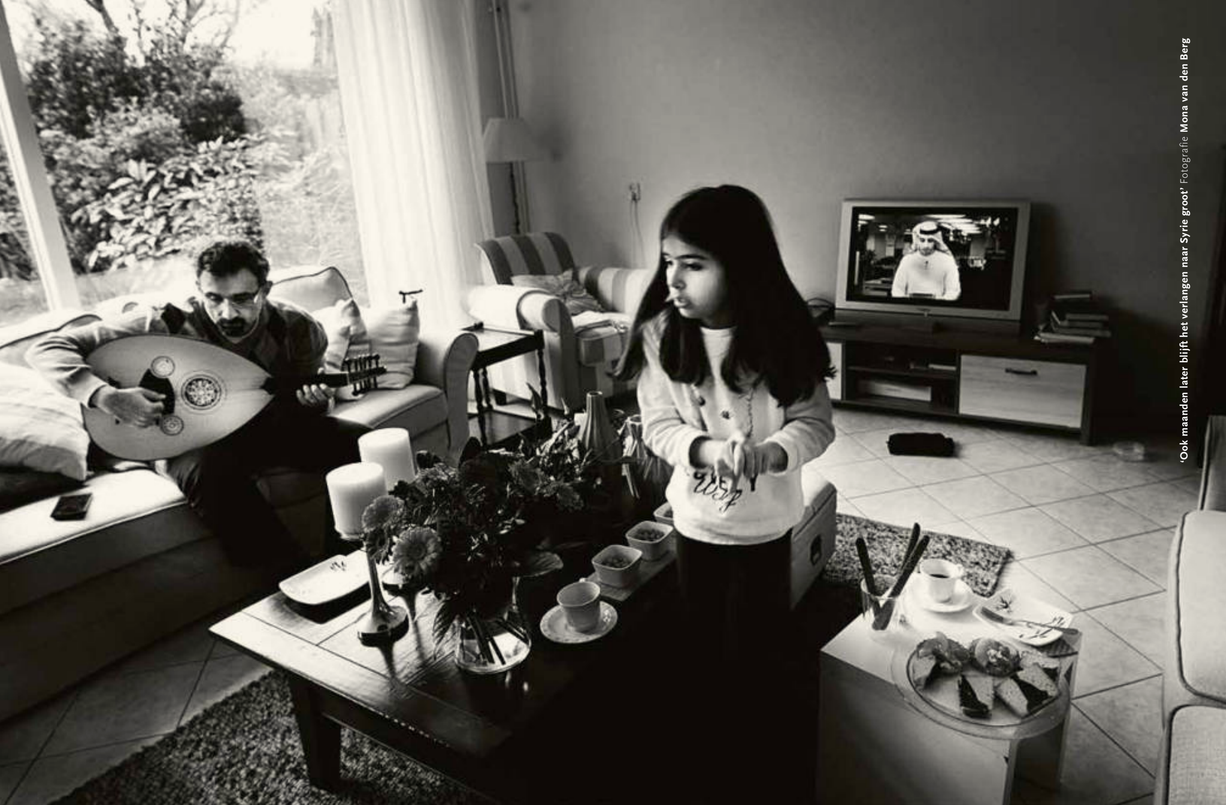
'Ook maanden later blijft het verlangen naar Syrië groot'